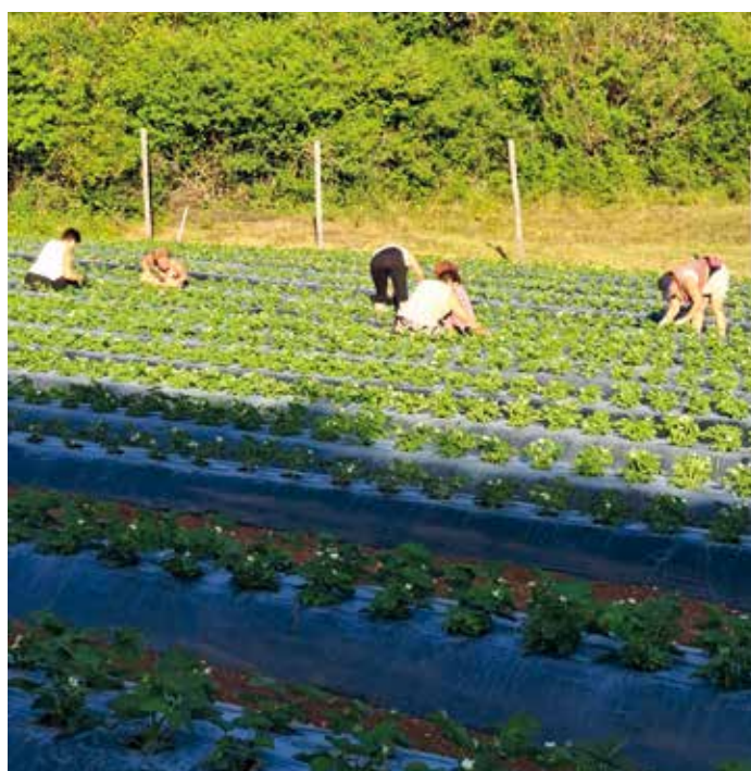
Ko je sezona pobiranja jagod, delajo od zore do mraka.