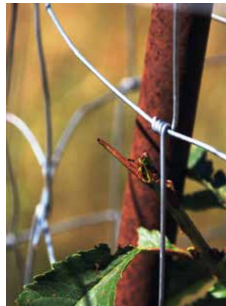
Četudi so drevesa ob sajenju zaščitena z električno ograjo, sadike pa z mrežo, jih to ne obvaruje pred objedanjem.

zadovoljni. V prihodnosti želi ohraniti raven kakovosti pridelave, kot jo ima zdaj, njegov velik izziv pa je pridobiti naziv inovativnega mladega kmeta.