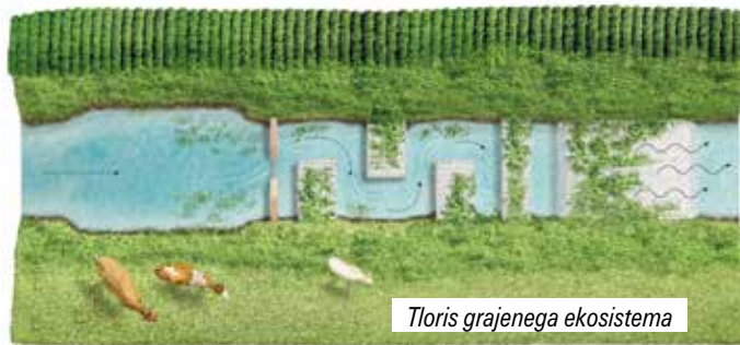
Tloris grajenega ekosistema

V projektu smo testirali pet različnih grajenih ekosistemov za reševanje različne problematike v osrednji in vzhodni Sloveniji. V projektu EIP GREKO smo se osredotočili na razbremenjevanje vode, predvsem trdih delcev,