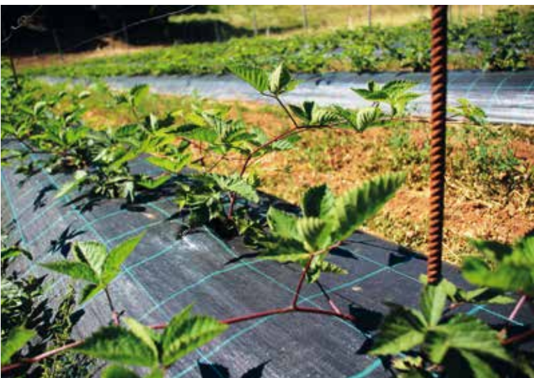
Letos so posadili nekaj jagodičevja, med drugim tudi robidnice.

nijo, kakor so te včasih. Včasih so te gledali podcenjevalno, v smislu, glej ga, kmeta, kot drugo pa, itak ti je vse dano s temi subvencijami.« Pravi, da najbolj uživa, ko mu pridelek uspe in ko vidi, da so ljudje z njim