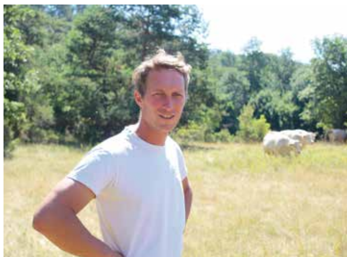
S pašo vzdržujejo v pridelovalni funkciji dobrih 50 hektarjev kraških pašnikov.

letni mladi prevzemnik, ki je ceni, kakor bi morala biti glede na to, da lahko integrirana