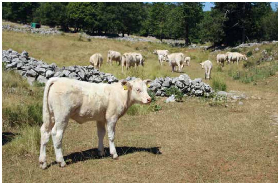
Čreda govedi pasme šarole je na kmetiji od leta 2006.

Na kmetiji se poleg pridelave jagod ukvarjajo tudi z rejo krav dojilj. Imajo 28 krav in pripadajočo mlado živino, skupaj okrog 70 glav. Večji del staleža krav predstavlja