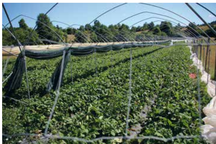
V zadnjih letih stavijo vse bolj na pridelavo jagod.

Draginja vpliva tudi na njihovo kmetijo – stroški so višji za tretjino.