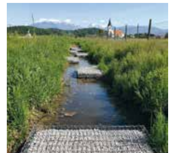
Jablje: odsek meandriranja

organskimi snovmi (gnojevka ...) in druge primere, kjer se pojavlja ve-