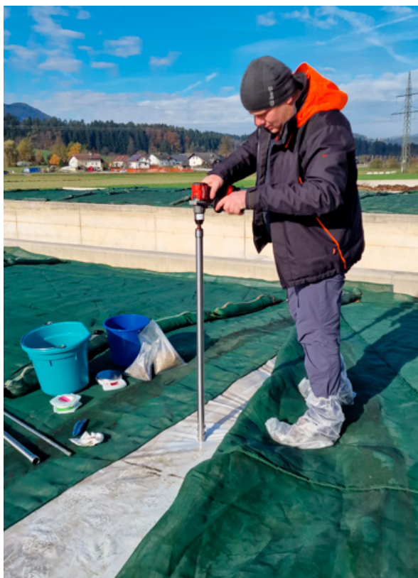
Slika 2: Odvzem vzorcev krme s pomočjo sonde in baterijskega vrtalnika

Na partnerskih kmetijah je bilo skupaj odvzetih 30 vzorcev doma pridelane krme. Ti vzorci so bili poslani v laboratorij LKS (Landwirtschaftliche Kommunikations und Servicegesellschaft) v Nemčiji. Rezultati laboratorijskih analiz krme so bili uporabljeni za analizo in optimizacijo krmnih obrokov za posamezne kategorije goveda na kmetijskem gospodarstvu. Prav tako so bili na vseh v projektu sodelujočih kmetijskih gospodarstvih odvzeti vzorci mleka za mikrobiološke preiskave, ki so bile opravljene na Veterinarski fakulteti Univerze v Ljubljani. Skupaj je bilo odvzetih 1548 vzorcev mleka 412 krav molznic. Izvidi mikrobioloških preiskav mleka so bili pregledani in pojasnjeni v sodelovanju z Veterinarsko fakulteto. Rejcem so bili pojasnjeni izvidi mikrobioloških preiskav mleka in predlagani ukrepi za izboljšanje zdravstvenega stanja vimena. Pripravljen je bil tudi tehnološki list o sanaciji S. aureus mastitisa. Na vseh petih kmetijah se je izbranim kravam molznicam v času presušitve in na začetku laktacije odvzela kri za hematološke in biokemijske laboratorijske preiskave. Vzorci krvi so bili odvzeti 104 kravam molznicam.