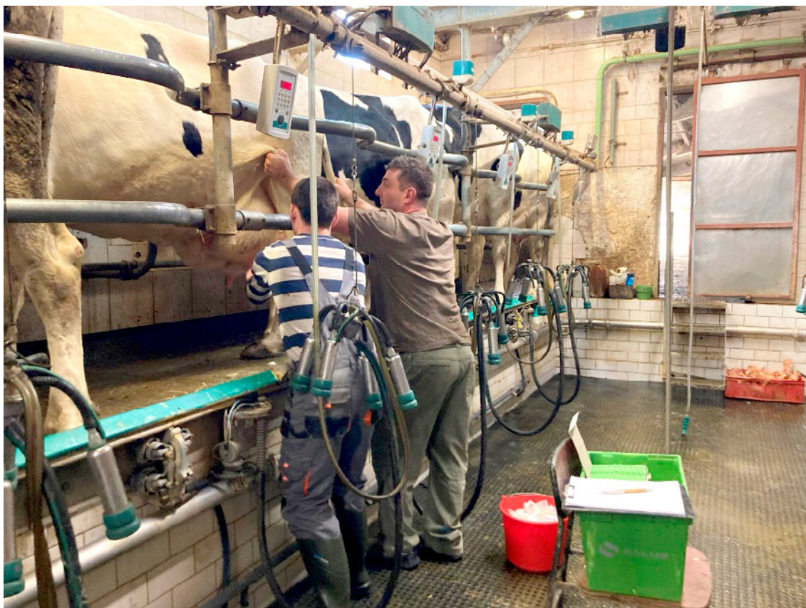
Slika 1: Odvzem vzorcev mleka na PP Agro