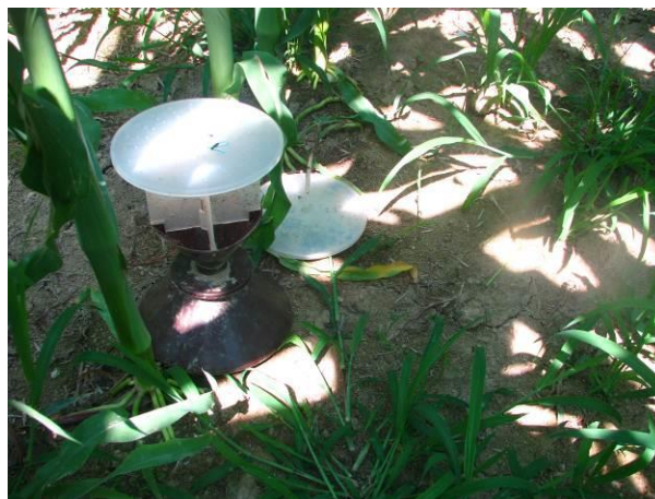
Slika 3: Talna feromonska vaba za pokalice

Ovire za širšo uporabo: visoka cena na enoto površine, na našem tržišču ni ponudnika (trenutno v uporabi za raziskovalne namene in namen monitoringa posameznih vrst).