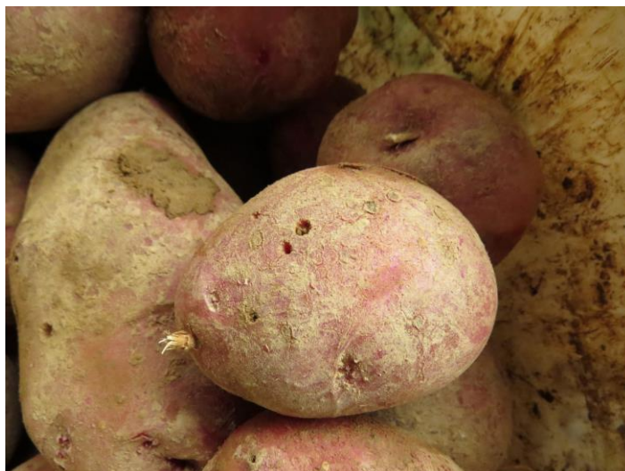
Slika 2: Gomolji krompirja navrtani od strun.