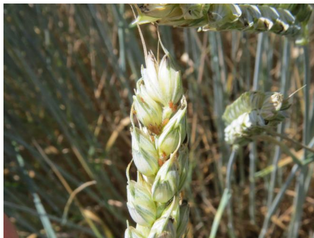
Slika 2: Listne uši se najintenzivneje hranijo na klasih v času mlečne zrelosti.

Na žitih se naselijo predvsem velika žitna uš ( Sitobion avenae ), zelena žitna uš ( Schizaphis graminum ), svetla žitna uš ( Metopolophium dirhodum ) in čremsina uš ( Rhopalosiphum padi ).