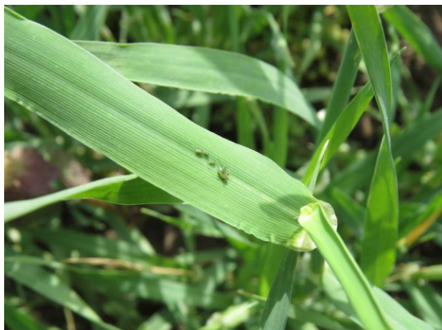
Slika 1: kolonija listnih uši na listu žita.

LISTNE UŠI (Aphididae) množično naselijo žita v obdobju začetka cvetenja in se najintenzivneje hranijo na klasih v času mlečne zrelosti. Poleg neposredne škode - zmanjšanja mase zrn, ki jo povzročijo s sesanjem sokov so škodljive tudi zaradi prenosa virusov, kar je lahko še posebej problematično v semenskih posevkih.