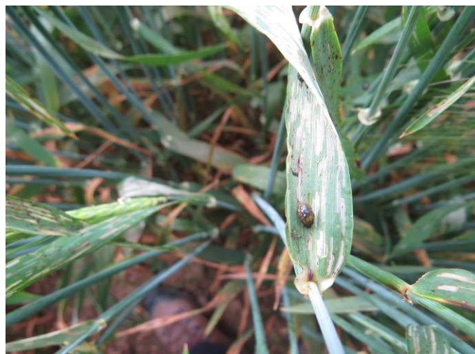
Slika 2: Poškodbe, ki jih na listih povzročijo ličinke žitnega strgača, prepoznamo kot podolgovate belkaste proge, ki so ob močnejšem napadu vidne že od daleč kot belkasti otoki, ki se širijo.

Za zatiranje ličink se odločimo na podlagi preseženega praga škodljivosti :