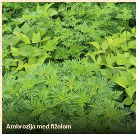
Ambrosija med fižolom