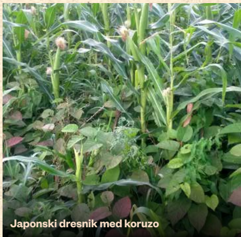
Japonski dresnik med koruzo