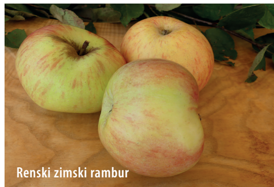
Renski zimski rambur