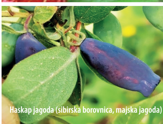
Haskap jagoda (sibirska borovnica, majska jagoda)