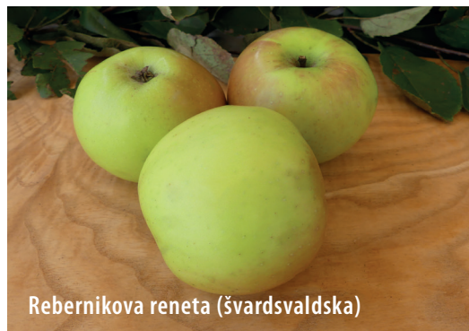
Rebernikova reneta (švardsvaldska)