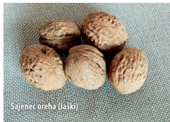
Sajenec oreha (laški)