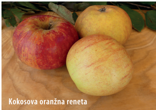
Kokosova oranžna reneta