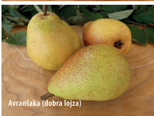
Avranšaka (dobra lojza)