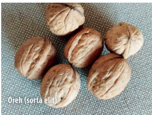
Oreh (sorta elit)