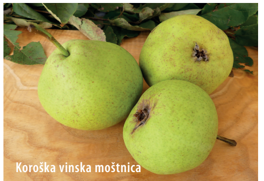
Koroška vinska moštnica