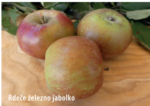
Rdeče železno jabolko