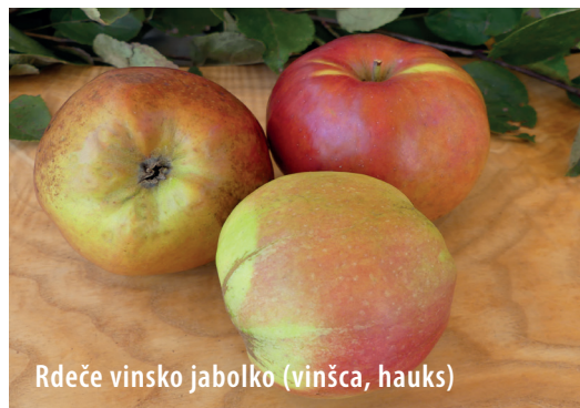
Rdeče vinsko jabolko (vinšča, hauks)