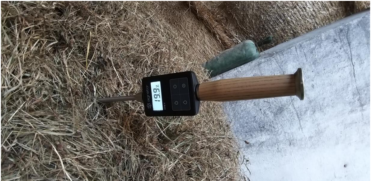
Slika 1: Merjenje temperature in vlage v balah z merilcem, katerega tipalo mora biti dolgo vsaj 0,5 m ali 1,0 m, tako da dosežemo sredino bale.

Stroški nakupa merilnika pa se lahko zmanjšajo, če se investicija v nakup te opreme razdeli med več kmetij, ki ga lahko potem uporabljajo tekom sezone. Na kmetijah zaenkrat naprav za merjenje vlage in temperature ni veliko, zato lahko temperaturo ocenimo tudi tako, da v sredino bale ali kupa potisnemo okroglo železo (npr. \varnothing 10 mm ali \varnothing 15 mm) s priostro konico in nato z otipom ocenimo temperaturo. Lahko si pomagamo tudi z doma narejeno temperaturno sondo v katero je vgrajen klasični termometer, ki jo nekatere kmetije že vrsto let uspešno uporabljajo (slika 2).